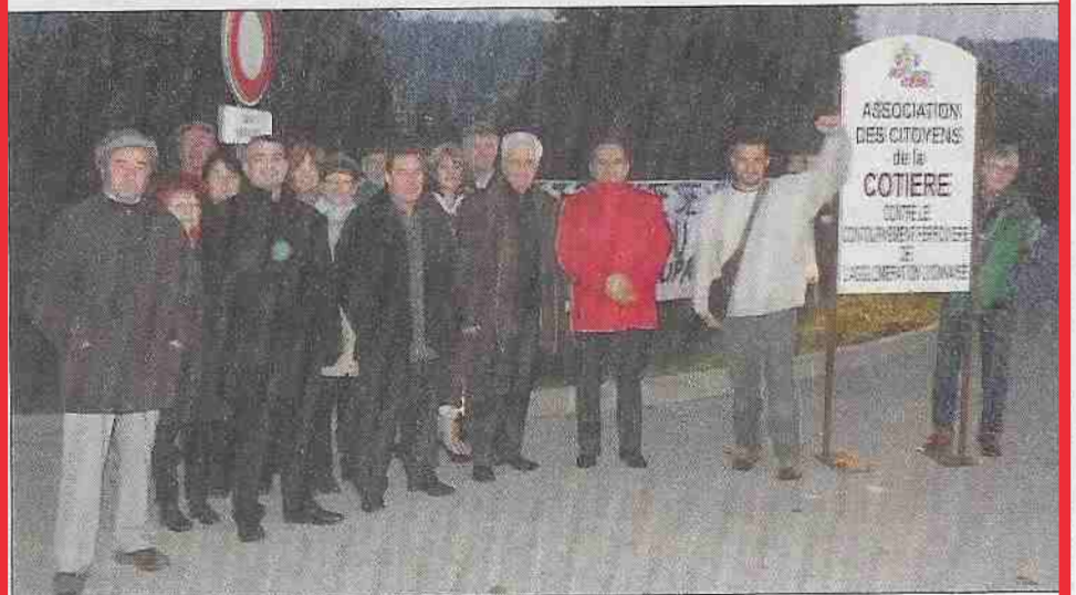
Les opposants au CFAL

qui a manifesté hier matin devant le poste de commandement opérationnel en présence de nombreux élus du canton de Montluel.